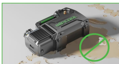
Ochrona przed wyciekaniem oleju