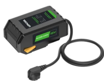
BC-18P, patrz strona 118 Pasuje do F2BR, 2F2BR Dostępny oddzielnie