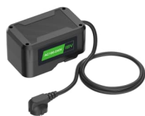
BC-18, patrz strona 118 Pasuje do F1B, 2F0B/2F0BR, 2F1B/2F1BR Dostępny oddzielnie